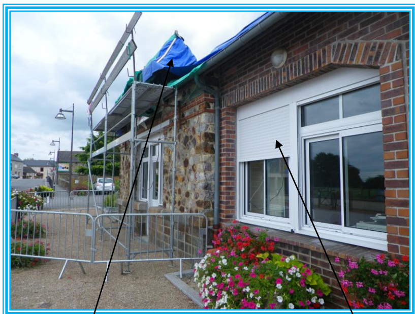
Rénovation de la toiture