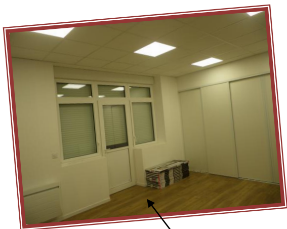
L'ancienne salle du conseil après les travaux : peintures réalisées, électricité refaite, fenêtres et portes changées, pose du parquet et placards installés