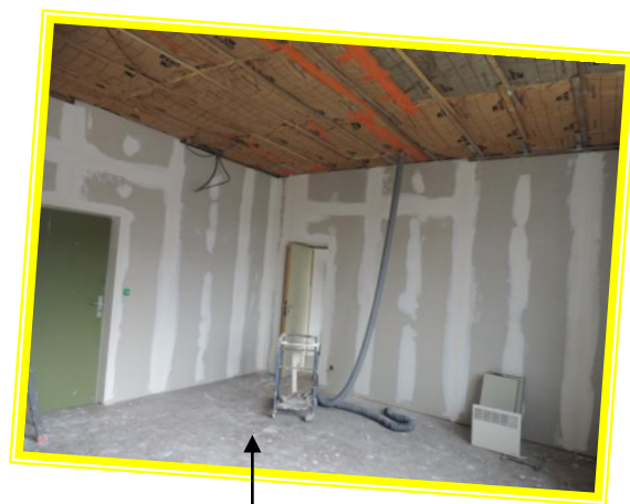
L'ancienne salle du conseil en travaux